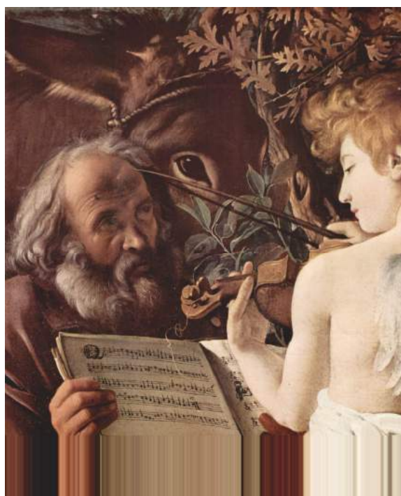
Caravaggio: particolare dal Riposo durante la fuga in Egitto [Roma, Galleria Doria Pamphili]

Le composizioni di Bauldeweyn, contenute in molti manoscritti ed edizioni a stampa indicativamente tra il 1510 circa e il 1575, testimoniano la reputazione di cui egli godesse nel Rinascimento. Bauldeweyn sapeva combinare sapientemente stilemi contrappuntistici più arcaici con quelli più innovativi della generazione di Josquin. La sua fama perdurava ancora verso il finire del XVI secolo quando Michelangelo Merisi da Caravaggio immortalò la parte del cantus nel « Riposo durante la fuga in Egitto » del 1595 circa.