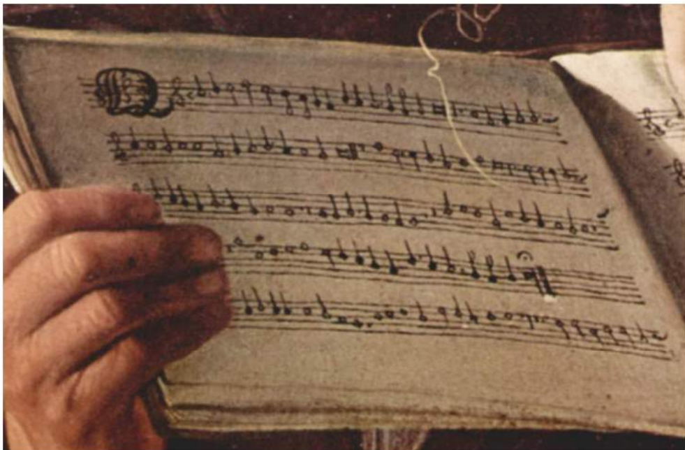
Caravaggio: particolare del Cantus dal «Riposo durante la fuga in Egitto»